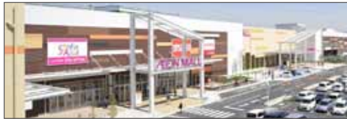
▲ イオンモール株式会社様 ショッピングセンター

個人情報保護とPマーク取得の目的でLanScope Catを導入しました。また資産管理とITリテラシーの向上を導入の目的としていました。これはモニタリングされていることの意識づけを行い不正操作の抑制を行う事と、万が一の場合に対応できる体制を構築するためです。数社の資産管理ツールと比較検討したところ、ログ管理と資産管理が同時にできるツールは当時ありませんでした。決め手となったのはLanScope CatのWebコンソールが運用を意識して開発されており、管理画面が見やすかった点が大きいです。